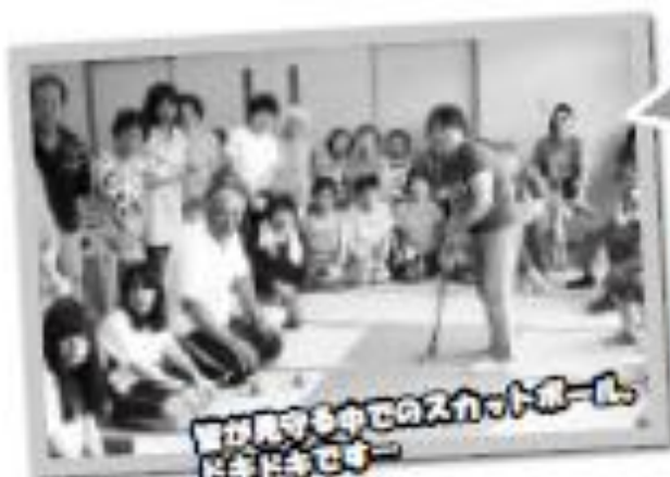
習が上手な中でのスイングがーん ドキドキですー