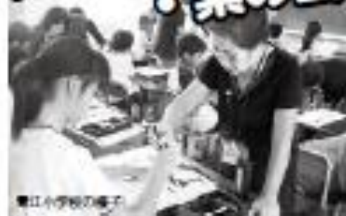
豊江小学校の様子