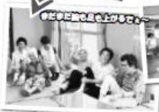
おどおど顔も足も上がるぞー

体操とDVD鑑賞。 DVDでは懐かしい昭和の時代を 思い出し、昔話に花が咲きました。