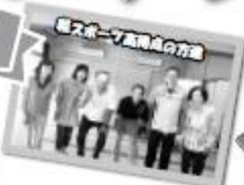
軽スポーツ高橋成の方達

津久見高校の先生や 生徒さんも体操や 軽スポーツに参加し、 笑いあふ時間を一緒に 過ごしました。