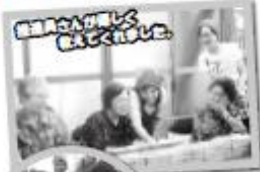
徳浦のみなさんが楽しく 遊んでくれました。

コミュニケーションマージャンで頭や 手をたくさん使って認知症予防もでき、 楽しみました。