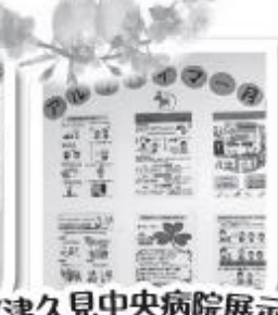
《津久見中央病院展示》