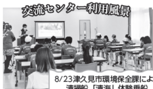
交流センター利用風景