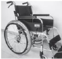
福祉機器の貸出事業

高齢者や障がい者など、住み慣れた地域の中でいつまでも穏やかに安心して暮らすことができるよう、各種の在宅福祉サービスを県や市などから受託して実施します。