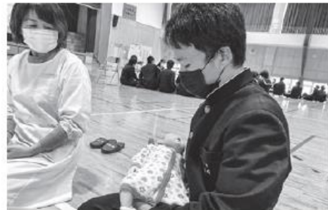
ボランティア協力校の活動

ボランティア活動への参加及び体験機会の提供や啓発を通して、ボランティア活動への意識の向上を図ります。