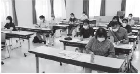
福祉施設・事業所等連絡会開催

関係機関や団体間の「顔見知りの関係づくり」を含め、情報の共有化などによる地域福祉活動の推進のため、地域を構成する多種多様な機関・団体との連携を強化していきます。