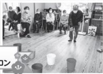
11/30 川上区小園町サロン