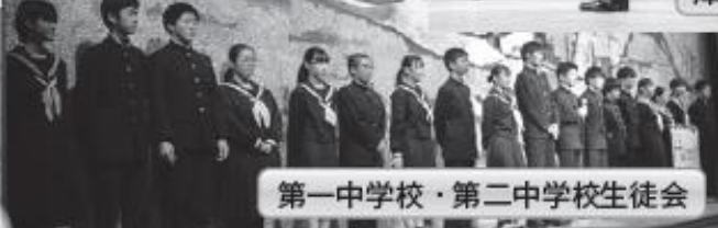
第一中学校・第二中学校生徒会

このショーの収益及び用途については、3ページに掲載しています。皆さま、ありがとうございました。