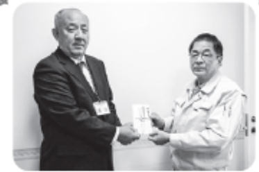
令和4年12月9日(金) 太平工専株式会社様より、一般寄付を賜りました。 あたたかいご協力ありがとうございました。