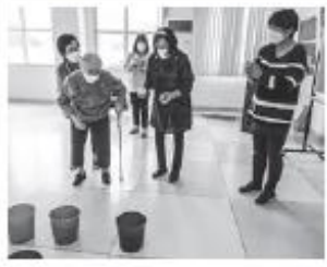
11/20 鳩浦イルカ島サロン