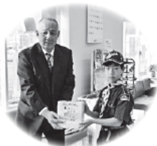
ボーイスカウト津久見第1団

中学校連合生徒会の皆さんが、チャリティーショー終了後に受付で募金活動を行ってくれました。(上)