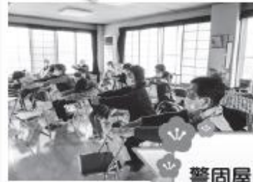
11/21 警固屋区セメント町サロン