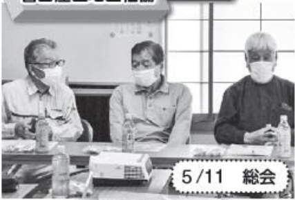
警固屋区地区社協