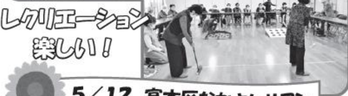
レクリエーション 楽しい!