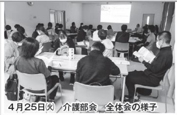
4月25日(火) 介護部会 全体会の様子