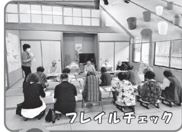
フレイルチェック