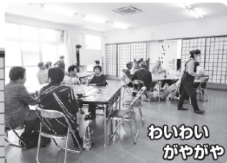
わいわいがやがや