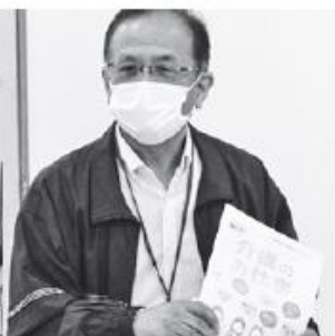
大分県社会福祉協議会 福祉人材センター