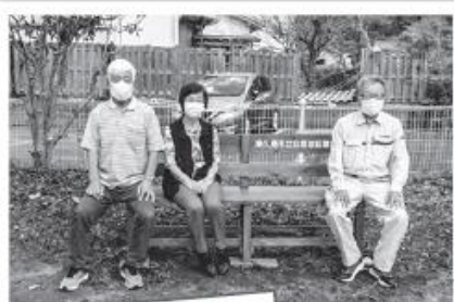
各区にベンチ設置