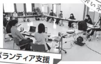
災害ボランティア支援