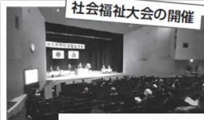
社会福祉大会の開催