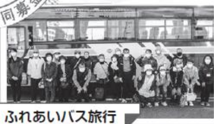
ふれあいバス旅行