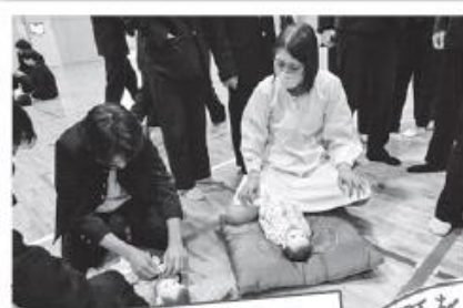
ボランティア協力校活動