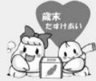
表1 個人・団体寄付(敬称略) 71,527円