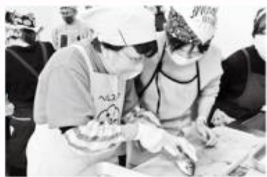
12/13 パパママ おさかなクッキング