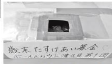
ボーイスカウト津久見第1団