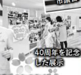
40周年を記念した展示