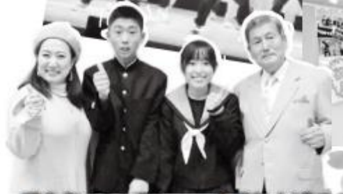
司会者の4人がショーを盛り上げてくれました。