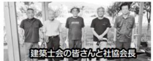
建築士会の皆さんと社協会長

赤い羽根共同募金からの助成金を活用し、津久見市建築士会の協力を得て、地域の“つどいの場”の一つとして活用していただくことを目的に、木製ベンチを昨年の10月に設置しました。