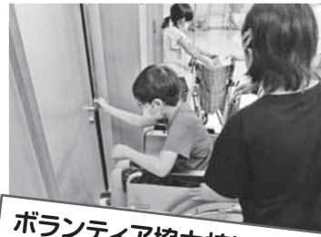
ボランティア協力校活動