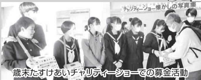
歳末たすけあいチャリティーショーでの募金活動