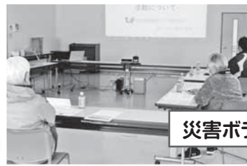
災害ボランティア支援