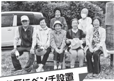
各区にベンチ設置

全国一斉に「じぶんの町を良くするしくみ」として、今年も「赤い羽根共同募金運動」が始まります。共同募金運動には、10月1日から12月31日までの3ヶ月間行われる「一般募金」と、12月の1か月間実施される「地域歳末たすけあい募金」があり、これらの募金は、高齢者や障がいのある方々を支える活動や子育ての支援、安全で安心なまちづくりの活動やそれを支えるボランティア活動等、幅広く津久見市の地域福祉向上のために役立てられます。本年も市民皆さまのあたたかいご理解とご協力をお願いいたします。