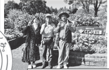
ふれあいバス旅行