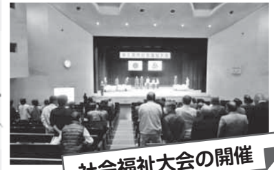
社会福祉大会の開催