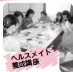
ヘルスマイト 養成講座