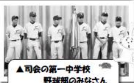
▲司会の第一中学校 野球部のみなさん