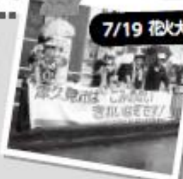
7/19 花火大会会場前の街頭呼びかけ