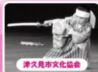
津久見市文化協会