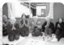
すきやきじゃんけん

体操とすきやきじゃんけんを行いました。サロンの間中、笑っぱなしの楽しいひとときでした。