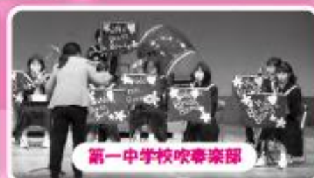
第一中学校吹奏楽部

このショーの収益および用途については、3ページに掲載しています。皆さま、ありがとうございました。