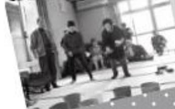
カラークイズゲーム