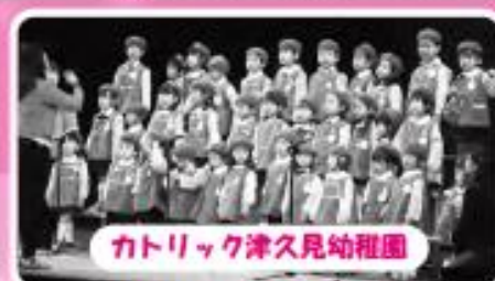
カトリック津久見幼稚園