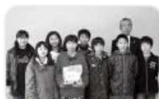
津久見小学校児童会の皆さん