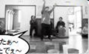
やったあ〜 入ったでえ〜