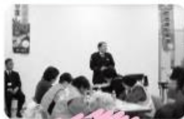
脳トレ型 交通安全教室