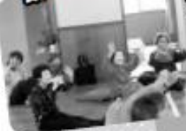
最高得点出ました!