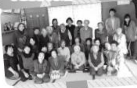
じゃんけん 勝ったで〜