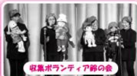
収集ボランティア鈴の会