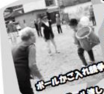
ボールかご入れ競争

サロンでの運動会。声をかけ合って競技では、息もピッタリ! 笑っぱいのサロンとなりました。