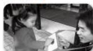
社会福祉協議会の理事、各種団体の皆さんによる街頭募金(写真上)