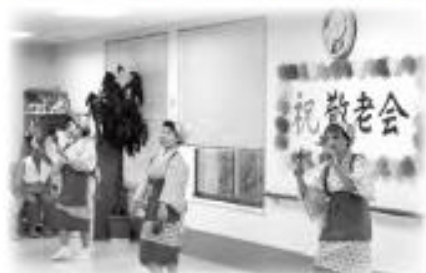
演芸披露 友情の会

いろいろな方に講師登録をいただいています。旅費や講師謝礼は無料となっております。地域や各種団体等の研修などにもどうぞご利用ください。