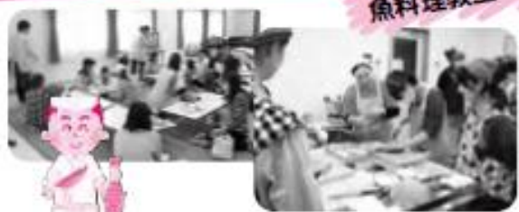
ママのための 魚料理教室