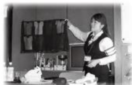
交通安全教室 交通安全協会