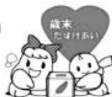
表1 個人・団体寄付者(敬称略)