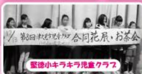
第8回津久見市合同花展・お茶会 聖徳小キラキラ児童クラブ