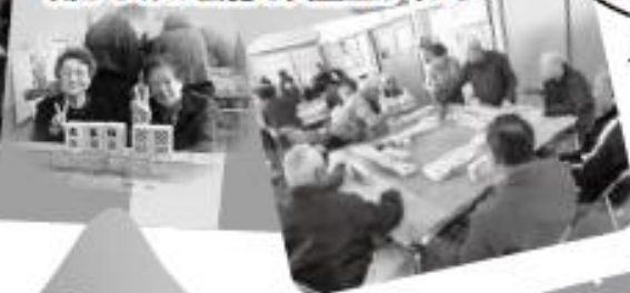
次はどのパイを すてようかなあ...