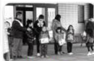
カトリック津久見教会・津久見幼稚園の皆さん(街頭募金)