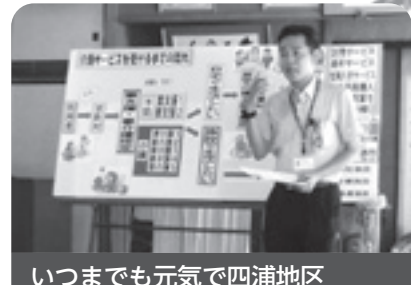
いつまでも元気で四浦地区 (四浦地区限定) 介護老人保健施設つくみかん サテライトみなみ

いろいろな方に講師登録をしていただいています。旅費や講師謝礼は無料となっております。