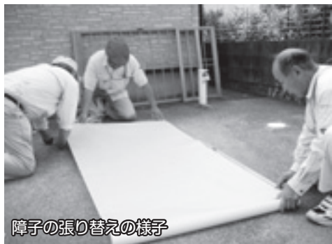
障子の張り替えの様子