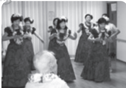
ハワイアン・フラ エンジョイつくみ