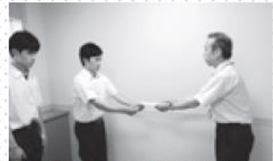
津久見高校生徒会より (7/12)

義援金募集は、現在も行っておりますので引き続き皆様のご協力をお願いいたします。(平成28年9月30日までの予定)