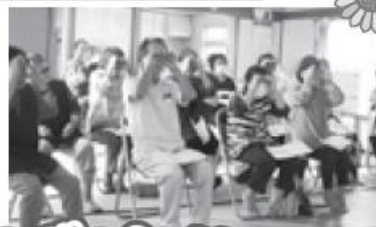
認知症地域支援推進員 による認知症講座