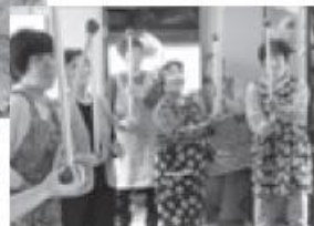
健康推進課による 健康教室