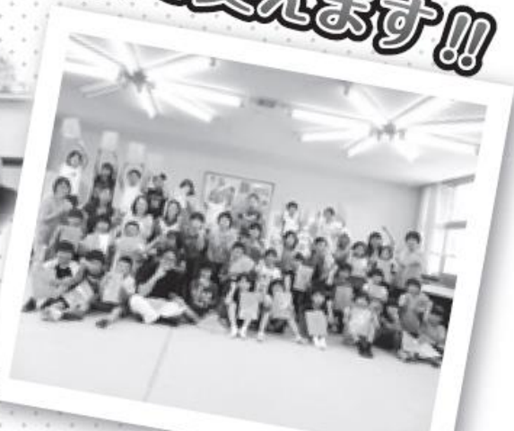
青江小学校4年生&保護者