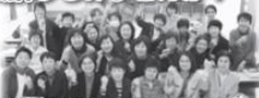
民生委員女性部会の みなさん