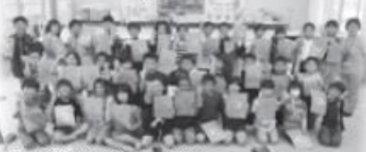
青江小学校4年生のみなさん