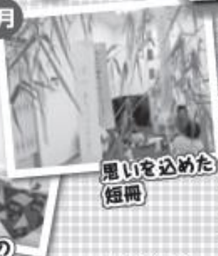
思いを込めた 短冊