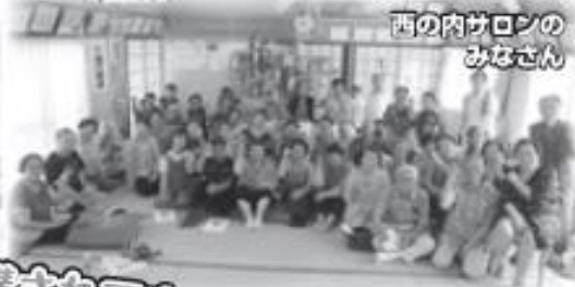
西の内サロンの みなさん