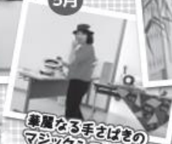
華麗なる手さばきの マジックショー