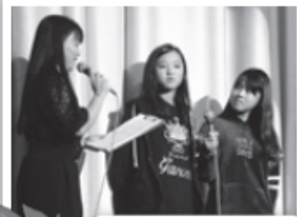
▲司会の津久見小学校児童会

11月24日、年末恒例のチャリティーショーが開催され、多くの方のご来場をいただきました。市民会館の改修工事や水害によって、3年ぶりの開催となりました。