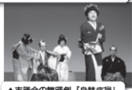
▲市議会の舞踊劇「身替座禅」