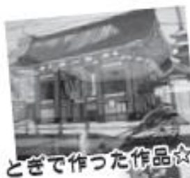
ときで作った作品☆