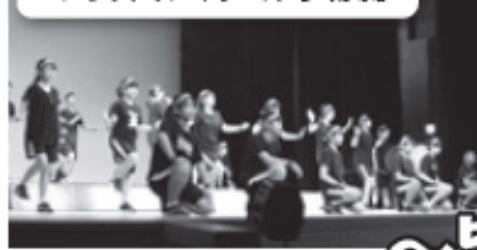
▼津久見第一中学校3年3組のダンス「ダイナミック琉球」