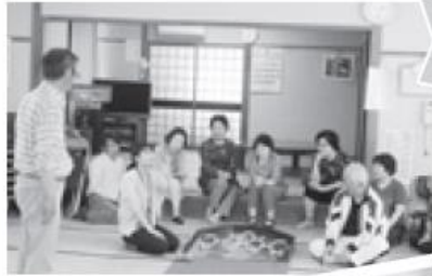
5/21(火) 旭町きずなサロン