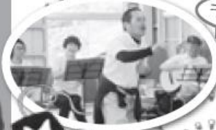
出前講座 「音楽友の会」