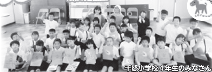
千怒小学校4年生のみなさん