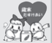
表1 個人・団体寄付 (敬称略)