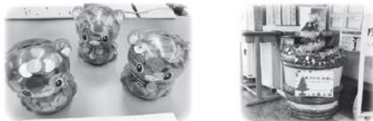
表3 区からの寄付 .....251,700円