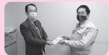
太平洋事(株)様より地域福祉向上の為に役立ててほしいとご寄付を賜りました。