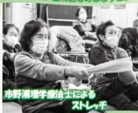
市野瀬理学療法士による ストレッチ