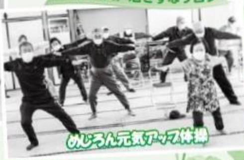
めじろん元気アーツ体操