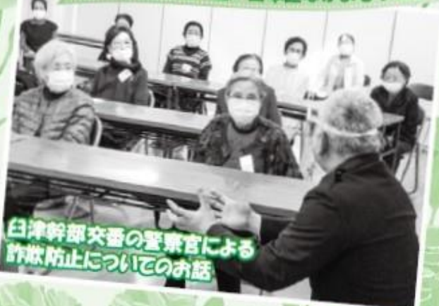
白津幹部交番の警察官による 詐欺防止についてのお話