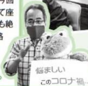
悩ましい このコロナ禍...